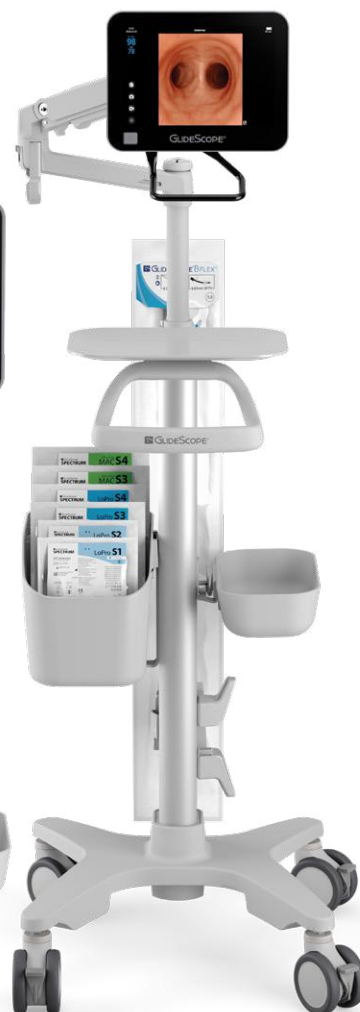
GLIDESCOPE CORE 10 MIT STANDARDANSICHT