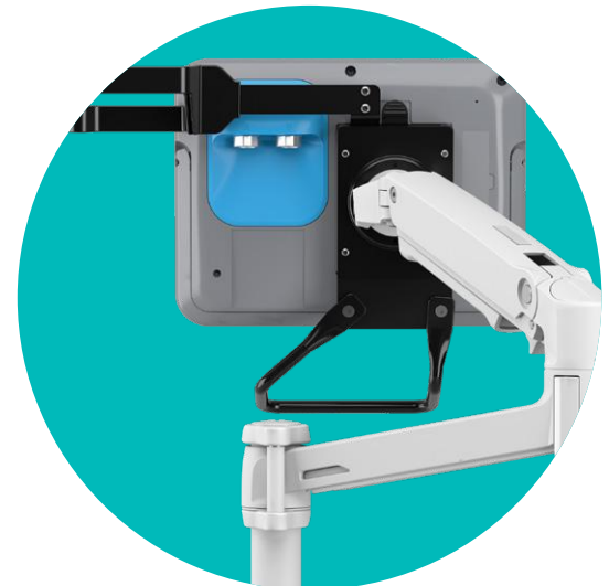
DUAL-PORT-ANSCHLÜSSE MIT QUICKCONNECT™-TECHNOLOGIE

BEI DER VISUALISIERUNG DER ATEMWEGE UND DES TRACHEOBRONCHIALBAUMS GILT: JE MEHR INSTRUMENTE GRIFFBEREIT SIND, DESTO BESSER.