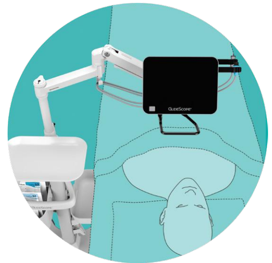
EINFACH EINSTELLBARE ARMPOSITIONEN ÜBER DEM PATIENTEN

GlideScope Core ist das erste Gerät zur Atemwegsvisualisierung mit multimodaler Live-Bildgebung für die Videolaryngoskopie und Bronchoskopie. Ihr System zur Atemwegsvisualisierung unterstützt jetzt auch bronchoskopiegestützte Verfahren im OP, auf der Intensivstation und in der Notaufnahme.