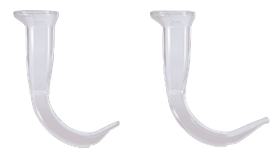
GVL 3 Stat