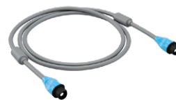
GlideScope Core QuickConnect-Kabel