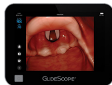
GlideScope Core 10