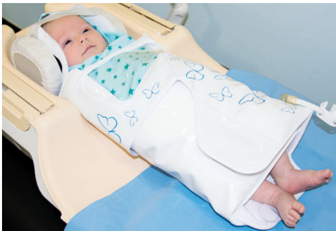
Abb. 1: Neugeborenes mit Lagerungshilfe in Kopfspule

In ausgewählten Fällen kann ein sogenanntes „Schoppen-MRT“ (oder auch „feed-and-sleep MRI“ bzw. „MRT im natürlichen Schlaf“) durchgeführt und auf eine Sedation verzichtet werden. Den kleinen Patienten wird kurz vor der Untersuchung eine Mahlzeit verabreicht, die Untersuchung erfolgt anschliessend in einer immobilisierten Lagerung.