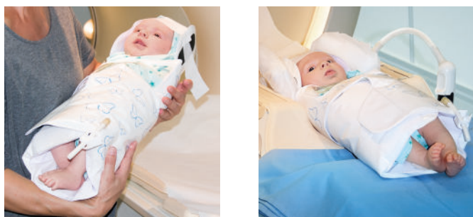
Abb. 5 und 6: Stillen oder Schoppengabe durch Mutter. Danach Neugeborenes in der MRT Spule platzieren.

Mittels einer Handpumpe wird die Lagerungshilfe zum Teil vakuumiert und das Neugeborene druckstellenfrei und stabil gelagert. Durch diese enge Lagerung können sich die Kinder häufig sehr gut beruhigen und das anschließende Stillen/Schoppengabe ist problemlos möglich.