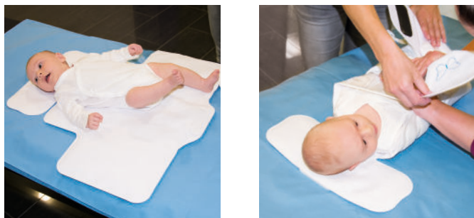
Abb. 3 und 4: Neugeborenes in MR-safe Body auf Lagerungshilfe positionieren, in Watte packen und in BabyFix Cocoon einwickeln.

Am UKBB wird für die Patientenlagerung auf das sogenannte BabyFix Cocoon (Pearl Technology AG, Schlieren/Schweiz) zurückgegriffen. Nachdem die Patientenüberwachung angebracht ist (wie oben beschrieben) werden die Kinder zunächst in Watte gepackt und dann in das BabyFix Cocoon eingewickelt.