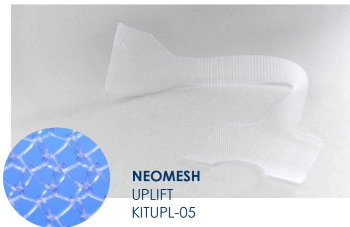
NEOMESH UPLIFT KITUPL-05